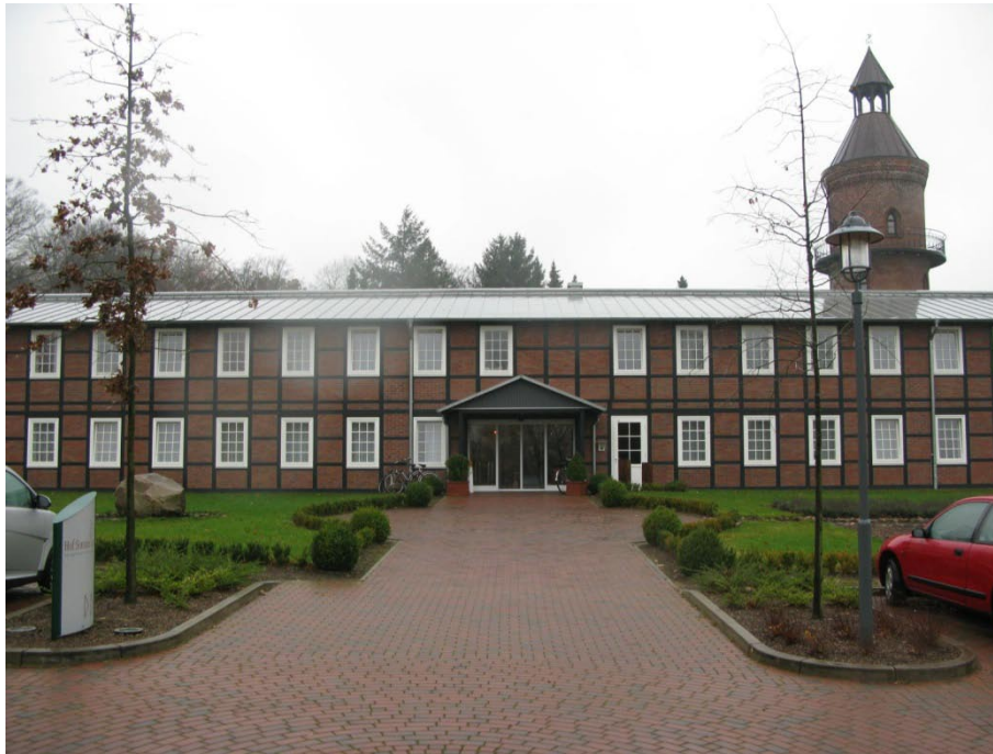
Ort des ersten Existenzgründertages